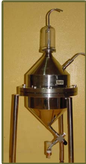
Patrón Nacional de Volumen

Unidad: m 3 , L Reproducción: la determinación del volumen del patrón nacional se fundamenta en el método gravimétrico, y se usa agua bidestilada para su realización. El valor de volumen del patrón nacional correspondiente a su última calibración es de 19,999 7 litros. Incertidumbre expandida: ± 0,003 8 % (k=2)