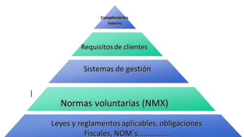
Fig. 2. Elementos de cumplimiento local y su jerarquía.

comercialización. La Figura 2 ilustra de forma simplificada los elementos de cumplimiento locales y como cuál es su orden jerárquico.