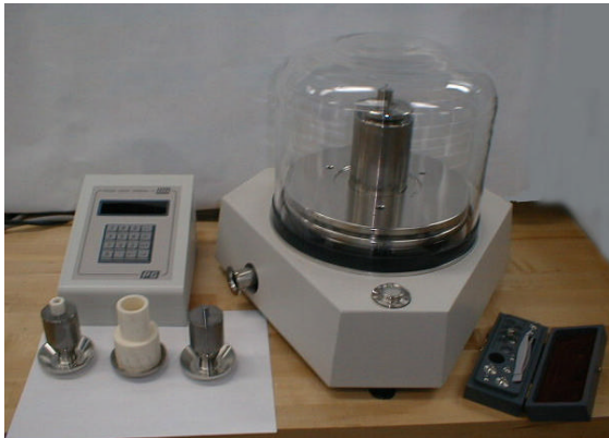
Patrón Nacional de Baja Presión.