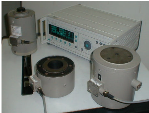
Patrón Nacional de Fuerza.

Celda de carga número de serie F 58 925, con un alcance de medición de 2 MN a 5 MN.