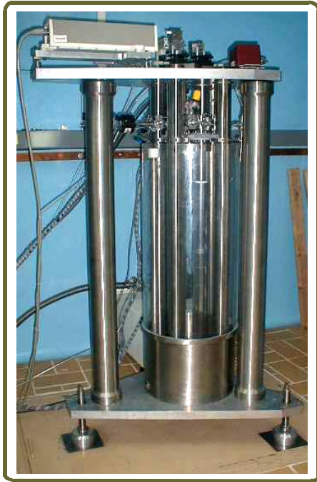
Patrón Nacional de Presión Barométrica APLICACIÓN

Incertidumbre: \pm 1 Pa, ( k=2 , con un nivel de confianza de aproximadamente 95%).